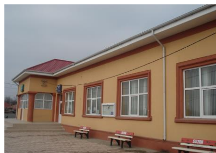
Căminul cultural Satu Nou

-au fost organizate numeroase acțiuni culturale, dintre cele mai importante amintim: Sărbători creștin ortodoxe „Boboteaza” semnificație și obiceiuri; Ziua internațională a femeii – Program artistic; „Hramul biserii Sf.