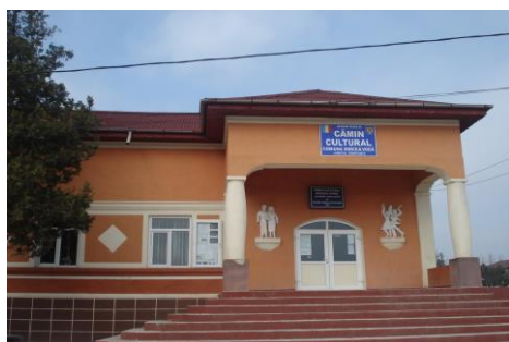
Căminul cultural Mircea Vodă