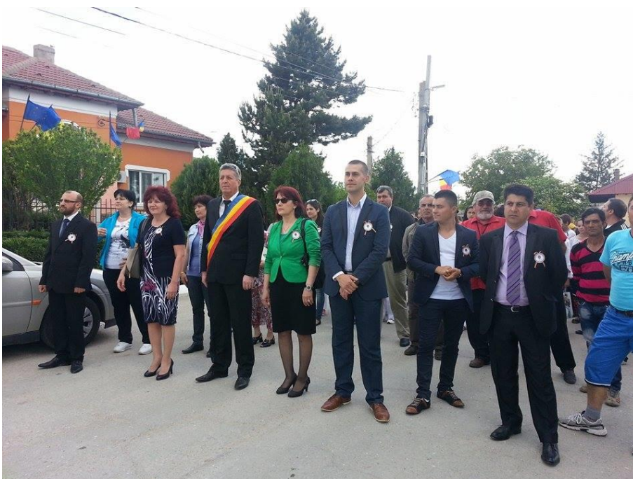
Ziua comunei Mircea Voda –plecarea catre Baza sportiva

▪ Acțiuni cultural-artistice și distractive: organizarea manifestărilor „Zilelele Comunei Mircea Voda,, ajunsa la a X-a editie, editie jubileu, constand in: competitii sportive, acordare de diplome si premii, demonstratii sportive, spectacol artistic sustinut de Ansamblul “Doina Dobrogei” din Medgidia si renumiti artisti din lumea cantecului si dansului.