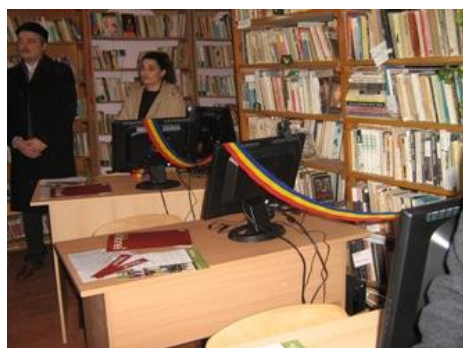
Biblioteca Mircea Vodă