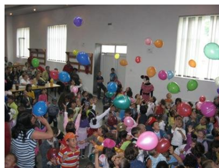
“Ziua internationala a copilului”