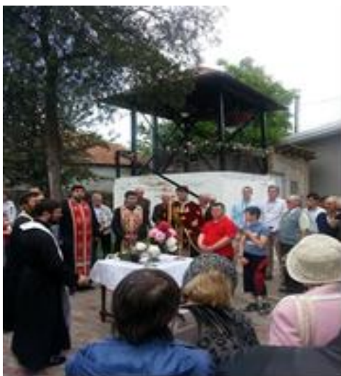
Hramul Bisericii din Mircea Vodă

Constantin si Elena ,manifestare organizata in data de 21 mai 2014 ,in colaborare cu biserica si biblioteca din comuna. ; Sarbatori crestin –ortodoxe Inaltarea Domnului/Ziua Eroilor, Ziua internationala a copilului, "Ziua Internationala a varstnicilor" organizata la data de 01.10.2014 , "Ziua Romaniei 1 Decembrie " ,depunere de coroare la Cimitirul International de Onoare "Mircea cel Batran" unde au participat aproximativ 80 de persoane;