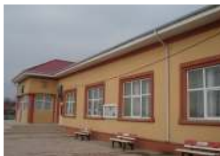
Căminul cultural Satu Nou