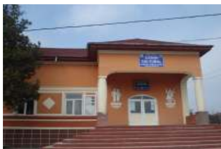
Căminul cultural Mircea Vodă