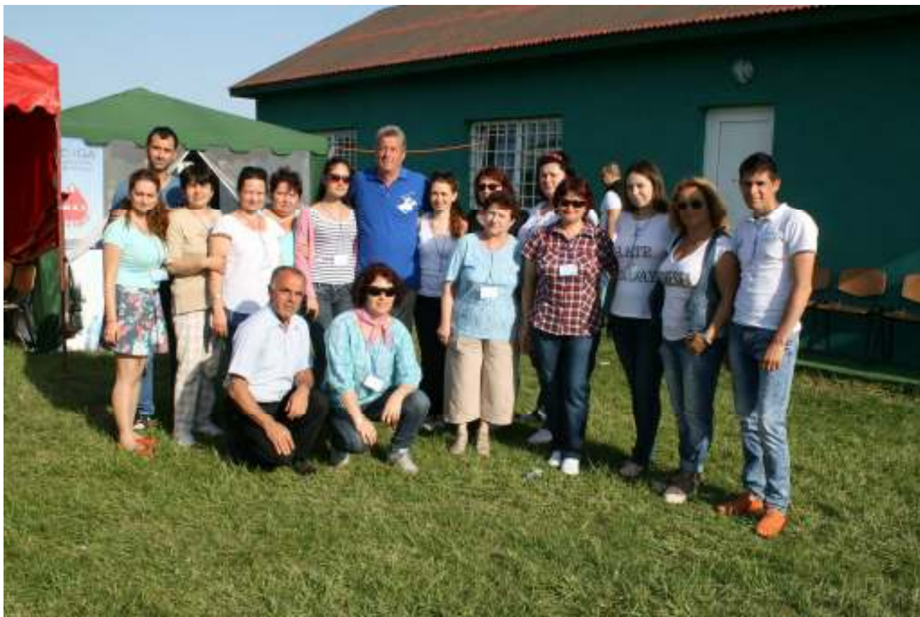
Ziua comunei Mircea Voda 2015

• Activități sportive: Clubul Sportiv „Dacia Mircea Voda” a fost înființat legal în anul 2002, în comuna Mircea Voda, județul Constanța, de către un grup de entuziaști, fani ai fotbalului, cu scopul declarat de a practica și dezvolta un sport cu valențe și satisfacții deosebite și care este foarte cunoscut și apreciat în toate țările lumii. Clubul Sportiv „Dacia Mircea Voda”, ocupă în anul 2015, locul 15 în Liga a-IV-a Campionatului Județean de Fotbal seniori. Tot la nivelul Clubului Sportiv „Dacia Mircea Voda” funcționează o grupă de TAEKWONDO W.T.F. care activează în Campionatul National al României, care este afiliată Federației Române de Taekwondo.